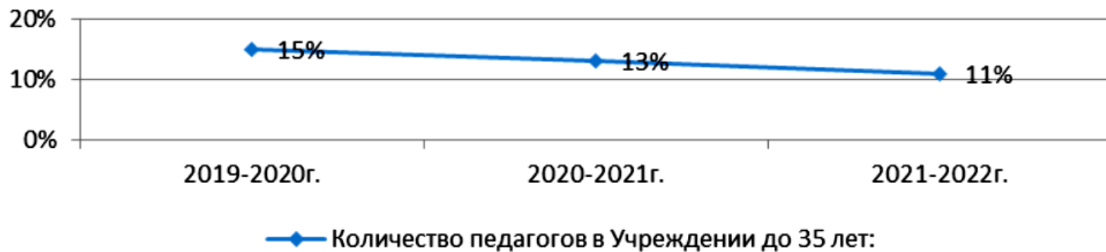
Количество педагогов в Учреждении до 35 лет: